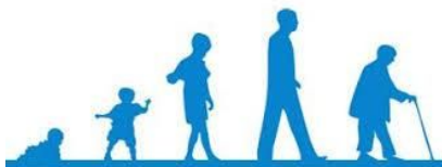
De levensloop van de mens